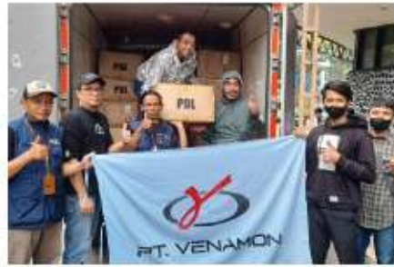
Bekerja sama dengan Jibar Quick Response untuk menyerahkan bantuan kepada korban bencana gempa Cianjur