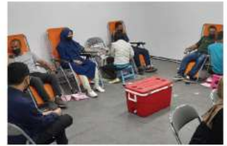
Kegiatan donor darah bersama PMI Kab. Bandung