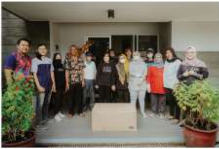
Penyerahan sepatu kepada Pemerintah Kec. Katapang